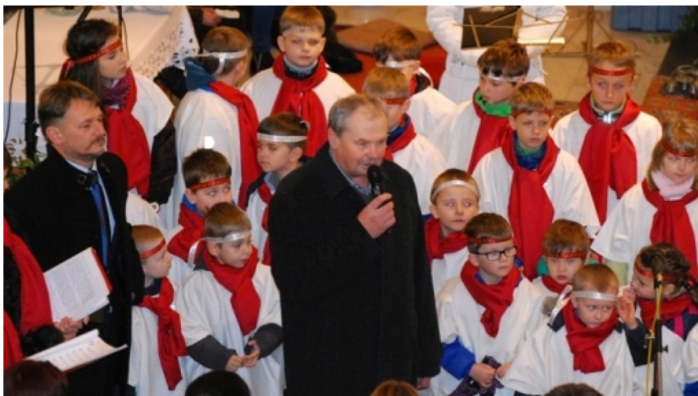
Adventní koncert v kostele sv. Vavřince ve Štáblovicích